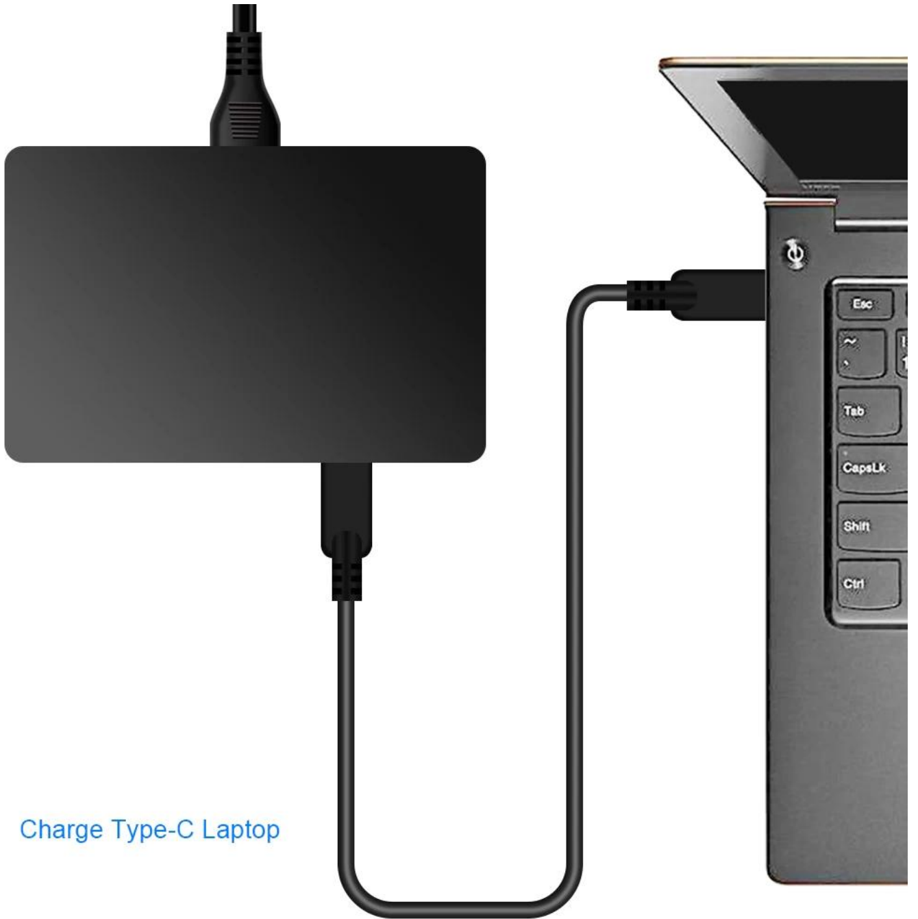
Charge Type-C Laptop